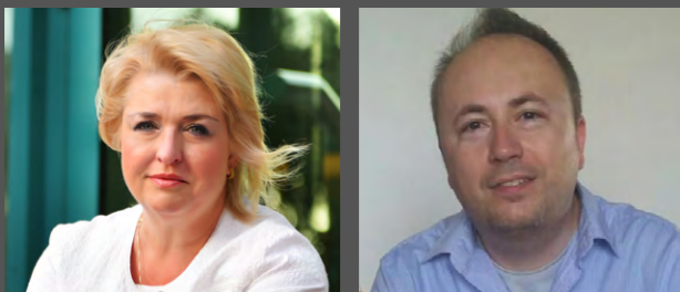
Autoři: Veronika FÁBEROVÁ a Pavel KRČÍLEK

Tato brožura byla zpracována v rámci projektu na ochranu měkkých cílů z dotace ministerstva vnitra v r. 2019