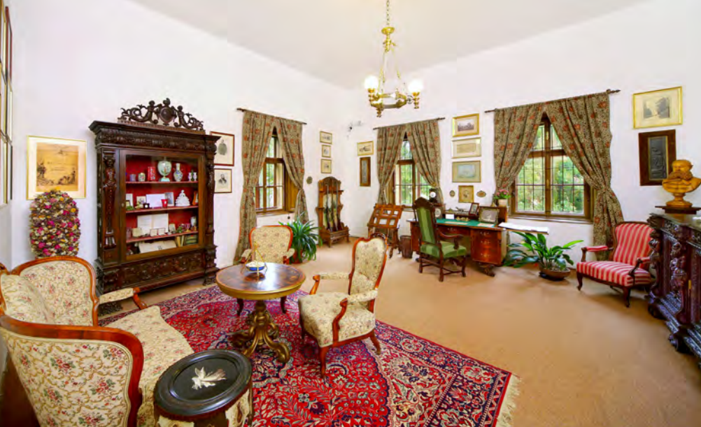
Zámecká expozice

Expozice Bílou stopou - kapitoly z dějin českého lyžování do roku 1938 přibližuje vývoj lyžování od prvních lyžařských pokusů u nás na konci 19. století až do předvečera druhé světové války. K oblíbeným exponátům patří nejen nejstarší typy u nás používaných lyží a vázání, ale také krásné medaile a kolorované snímky. Atmosféru doplňují figuríny v dobovém lyžařském oblečení. Nechybí film z roku 1926, který zachycuje velké lyžařské závody v Jilemnici. Expozice je umístěna v sálech starého hraběcího pivovaru, jímž podobu vtiskl Jan Nepomuk hrabě Harrach, který na Jilemnicko nechal přivést první lyže.