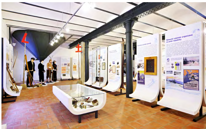
Lyžařská expozice

Historicko-etnografická expozice přibližuje vývoj západních Krkonoš od středověku po novověk a soustřeďuje se na Jilemnici jako přirozené centrum obchodu a řemesel. Zajímavý je například dochovaný soubor 33 pohřebních štítů zdejších cechů z 1. poloviny 19. století. V plně zařízené tkalcovské světnici se pak nachází unikátní mechanický betlém Jáchyma Metelky z let 1883-1913. Původní mechanismus pohybuje více než 140 figurkami, které předvádějí zhruba 350 druhů pohybů, vše pak za doprovodu zvukových efektů.