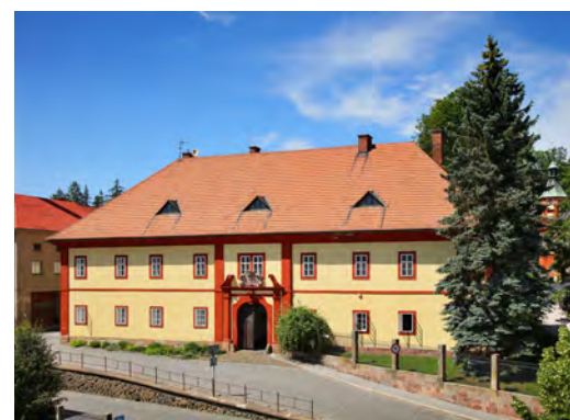
Starý pivovar

poroval budování botanických zahrádek na hřebenech hor a tak dále.