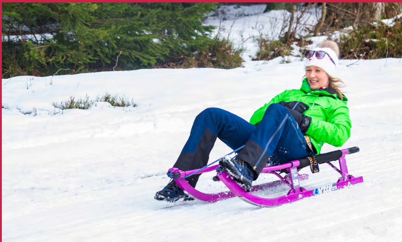
Sáňkařská dráha, Smržovka