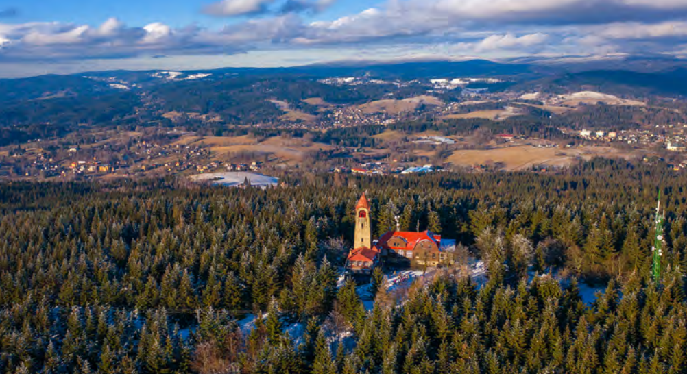
Rozhledna Černá Studnice

žovce, kde můžete spojit příjemnou procházku s nevšedním zážitkem na přírodní sáňkařské dráze. Tato dráha měří téměř 4 kilometry a začíná přímo